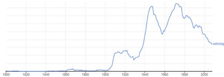
Рис. 1. Поширення терміна «саботаж» французькою мовою

Як уже зазначалося у попередньому дослідженні, Російські та радянські джерела надають доволі стисле визначення. Велика радянська енциклопедія визначає саботаж як навмисний зрив будь-якого заходу, ухилення від роботи або умисне несумлінне її виконання [4]. Тлумачний словник Ушакова визначає саботаж як навмисне-несумлінне виконання обов'язків, ухилення від роботи або злісний зрив роботи за дотримання видимості її виконання [5].