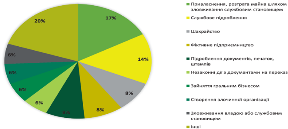
Рис. 2. Структура предикативних злочинів у кримінальних провадженнях за 2019 рік [4]

Ці злочини мають корупційні ознаки. Економічна злочинність на корупційній основі реально загрожує національній безпеці України, впливає практично на всі сфери суспільного життя – соціальну, правову, політичну. Корупція є передумовою і наслідком функціонування тіньової економіки держави, а суб'єкти корупційних діянь – одні з основних споживачів послуг з відмивання коштів, і водночас – неодмінні учасники більшості схем їхнього «відмивання». Саме тому без радикального зниження рівня корупції заходи щодо детінізації національної економіки, запобігання та протидії організованій злочинності не дадуть очікуваного ефекту. Спроби побороти корупцію лише за допомогою вибіркового покарання за корупційні діяння не будуть ефективними, оскільки залишаються глибинні чинники цих соціальних поведінкових деструкцій.