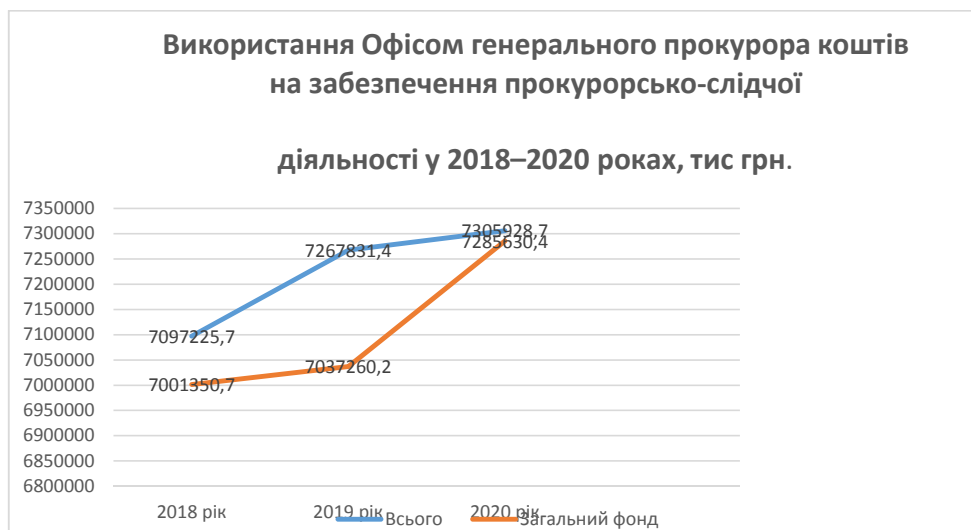
Рис.2. Використання Офісом генерального прокурора коштів на забезпечення прокурорсько-слідчої діяльності у 2018–2020 роках [Розроблено автором за даними 10,11]

Як видно з рисунку видатки державного бюджету на забезпечення прокурорсько-слідчої діяльності щороку збільшувалися. Так видатки у 2020 році в порівнянні з 2019 зросли на 38097,3 тис. грн., а в порівнянні з 2018 роком – на 208703 тис. грн.